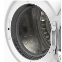
Tambour inox Soft Drum™